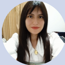
Médicas Residentes de Psiquiatría (2do.Año.)

En el transcurso de nuestra práctica clínica empezamos a encontrar situaciones que creemos, ameritan un análisis profundo y que nos generaron interrogantes que finalmente impulsaron que estemos hoy escribiendo este artículo.