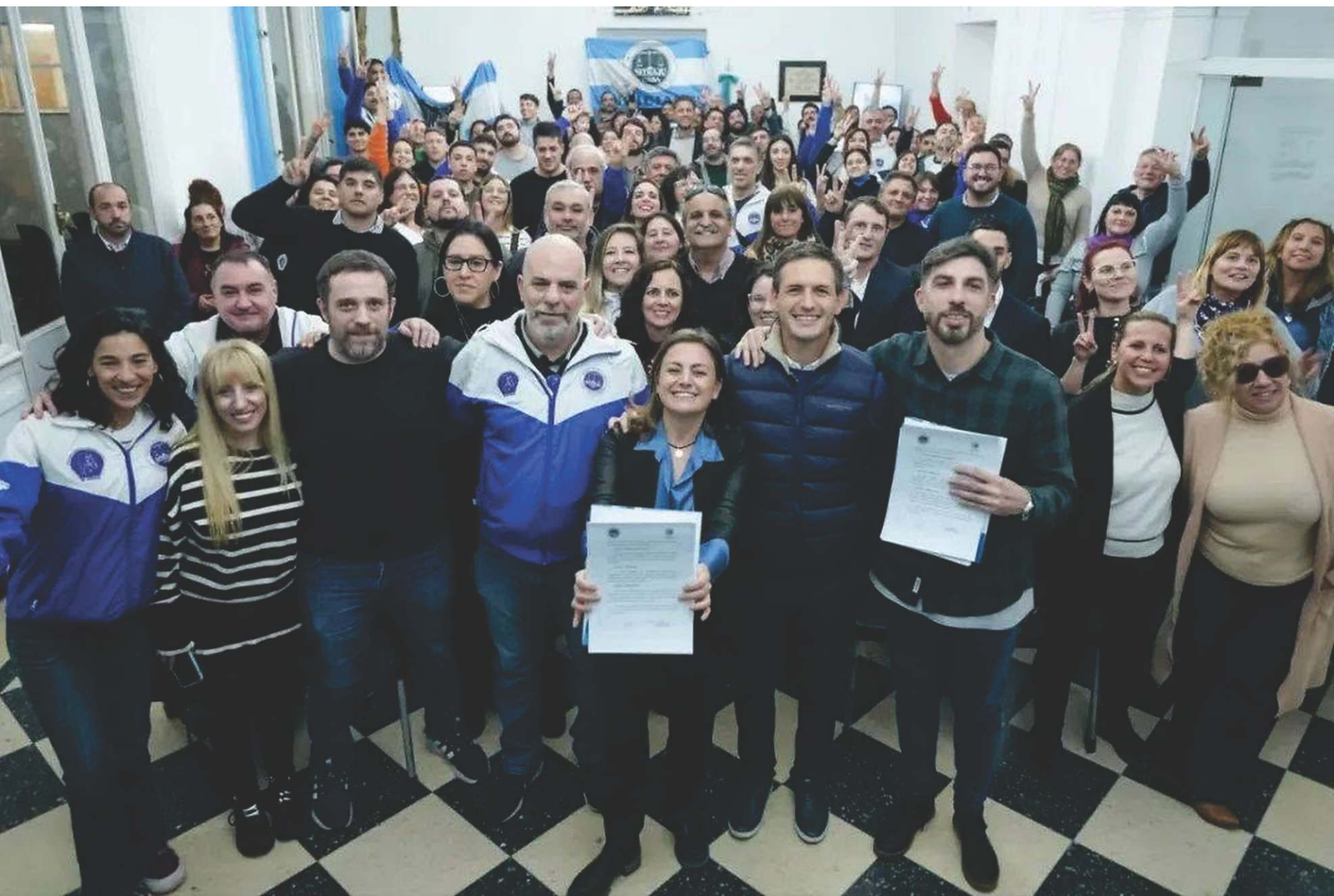
Firma de Acuerdo con el Municipio de San Vicente.