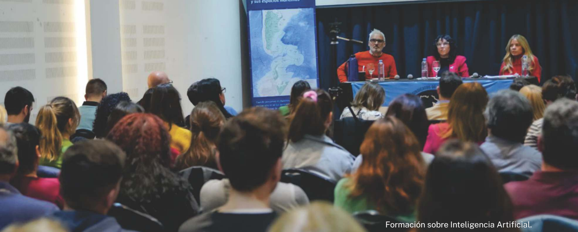
Formación sobre Inteligencia Artificial.