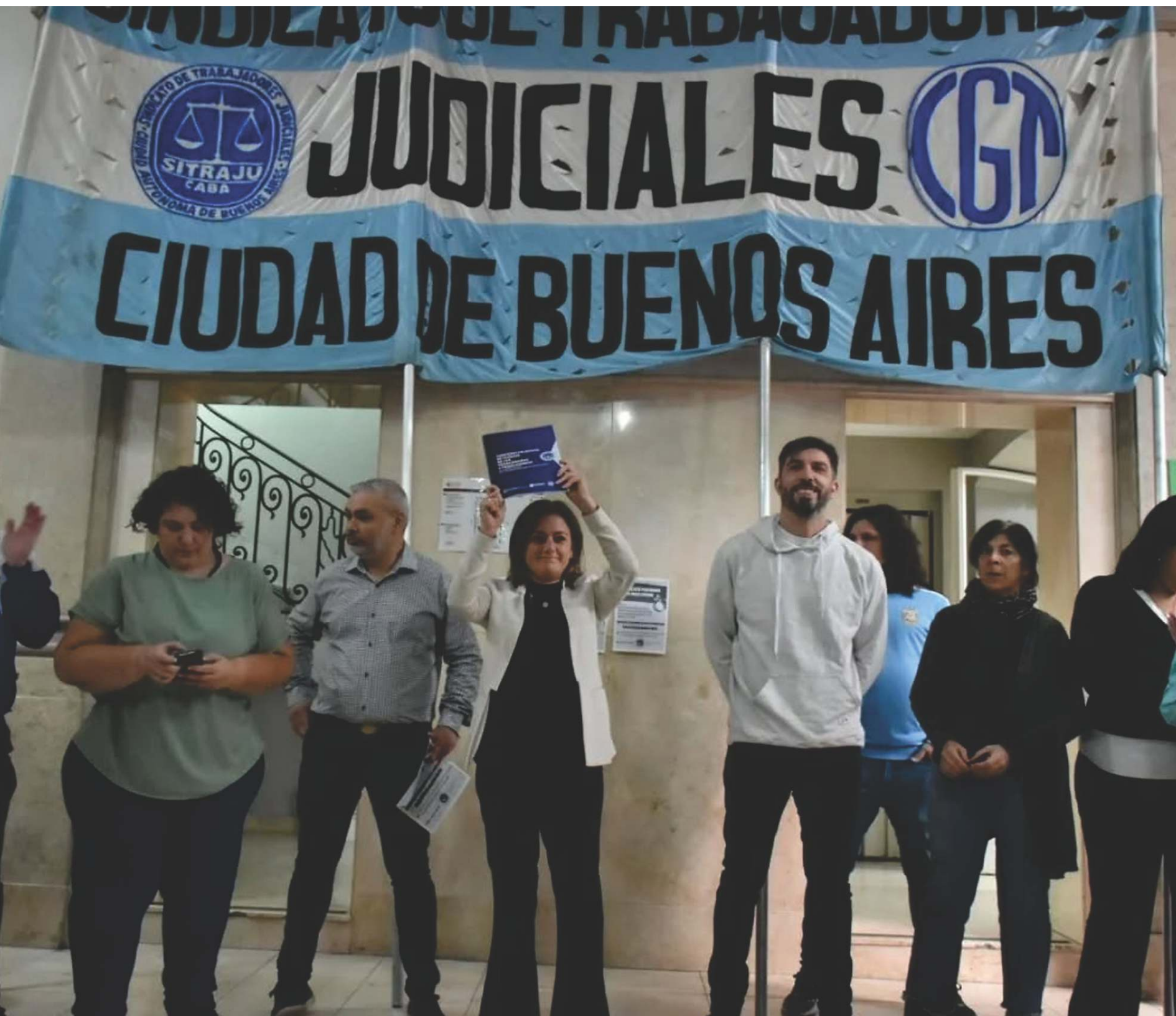
Movilización en el Tribunal Superior de Justicia / CABA